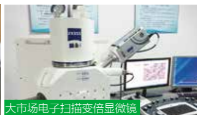
大市场电子扫描变倍显微镜