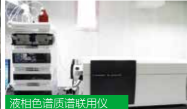
液相色谱质谱联用仪