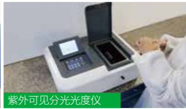
紫外可见分光光度仪