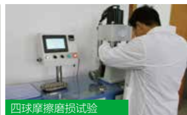
四球摩擦磨损试验