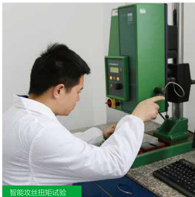
智能攻丝扭矩试验